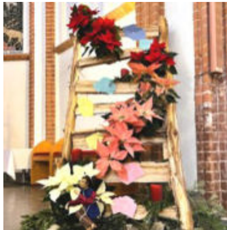
Die geschmückte Adventsleiter

Tiefe. Sie wird aufgestellt, um etwas zu erreichen, was zu hoch ist, eben Oben und Unten. Diese stellt in der Sprache der Gläubigen (Symbolik unseres Glaubens) Himmel und Erde dar, Gott und der Welt und schlussendlich der Verbindung zwischen Gott und Mensch. Die Leiter stellt eben diese Verbindung, diesen Weg dar. Gott kommt herab zu uns Menschen, Stufe für Stufe, Schritt für Schritt. Und so (er)warten wir ihn... Gottesdienstbesucherinnen und -besucher wurden eingeladen, ihre Gedanken, Bitten und Hoffnungen auf kleinen Kärtchen festzuhalten,