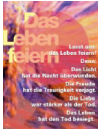
Bild: Peter Weidemann (Foto), Gisela Baltés, impulstexte.de (Text), Sven Jäger (Layout) In: Pfarrbriefservice.de

Hildegard Bzowka Emil Medwed und Manfred Herrmann