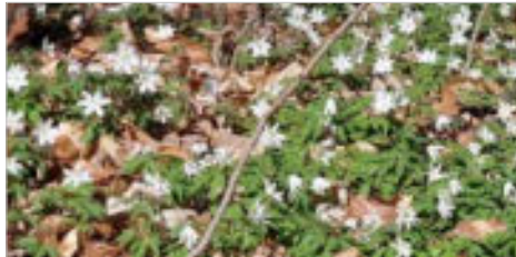
Buschwindröschen im Bucher Forst