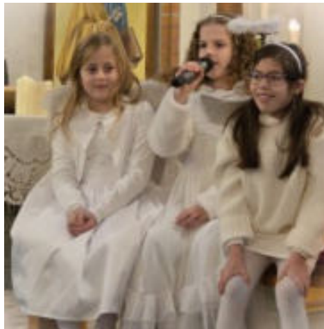
Krippenspiel. Drei Engel über dem Stall