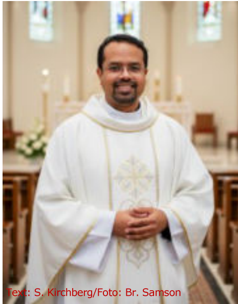
Text: S. Kirchberg

Zu ihrer Feier lud Frau Ritter aber auch noch einen besonderen Gast ein, der an diesem Tag zufällig ebenfalls Geburtstag hatte: Bruder Samson.