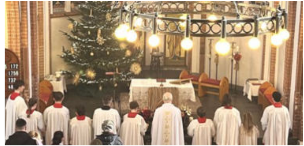
Mit Lampenfieber und sehr aufgeregt, neue Ministranten und Ministrantinnen am Altar

tei vor dem Einzug war spürbar. Dann ertönte der Gong – und mit den ersten Schritten im Ministrantengewand durch die Kirche begann für sie ein neuer Weg des Mitwirkens am Gottesdienst. Der Stolz und die Freude waren ihren Gesichtern deutlich anzusehen.