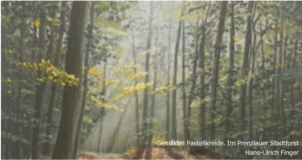
Gemälde: Pastellkreide. Im Prenzlauer Stadtforst Hans-Ulrich Finger

Beim Blick auf diesen Wald denke ich als Förster unweigerlich an die Arbeit der Menschen, die in den vergangenen hundert Jahren in diesen Bestand geflossen ist. Generationen von Förstern haben hier gewirkt: Die Bäume wurden einst mühsam von Hand gepflanzt, gepflegt und gegen konkurrierende Vegetation sowie gegen Wildverbiss geschützt. Mit Sachverstand und Geduld wurden später einzelne Nachbarn entnommen, um den besten Stämmen Raum zum Wachsen zu geben. Jeder Baum erzählt von Planung, Verantwortung und dem Bemühen, den Wald nachhaltig zu erhalten und für kommende Generationen zu entwickeln. Der Wald ist damit nicht nur Naturraum, sondern auch Zeugnis menschlicher Arbeit, Erfahrung und Fürsorge. Gleichzeitig sehe ich diesen Wald als Christ mit anderen Augen. Er erinnert mich an Gott, der die Schöpfung mit all ihren Pflanzen und Tieren ins Leben gerufen hat. Das Licht, das durch die